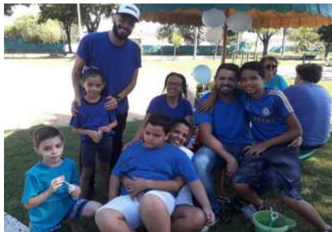
Pique Nique Azul